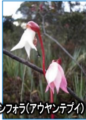
ヘリヤンフォア(アウヤンテピ)