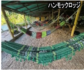
ハンモックロッジ