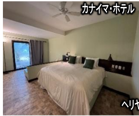
カナイマ・ホテル