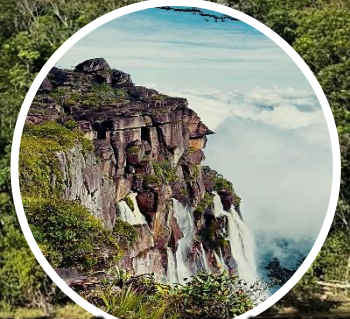
世界一の滝 エンジェルフォールの滝口(2025年10月)