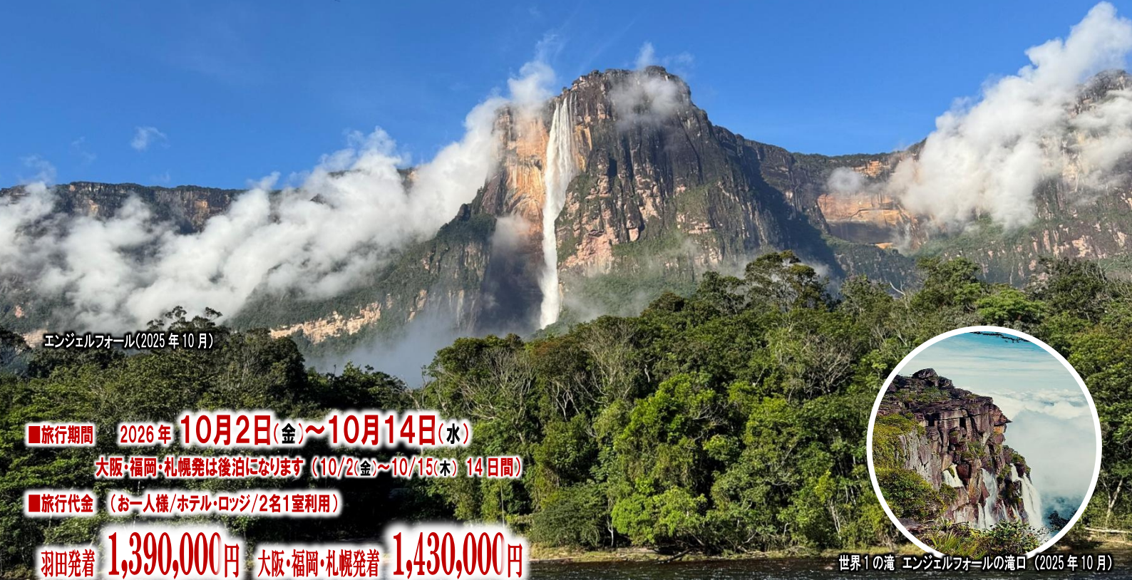
エンジェルフォール(2025年10月)