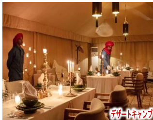
デザートキャンプ