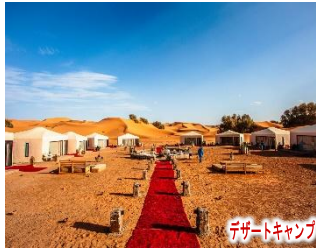
デザートキャンプ