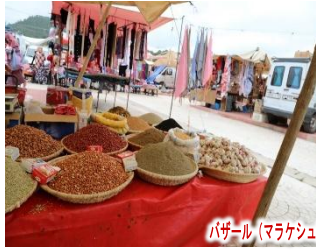
バザール(マラケシュ)