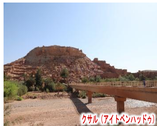
クサル(アイトベンハッド)