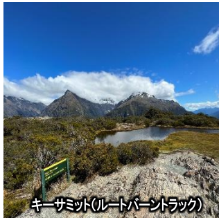
キーサミット(ルートバートラック)