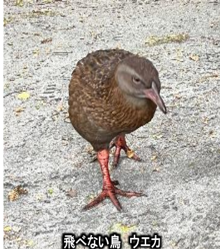
飛べない鳥 ウエカ