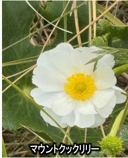
マウントクックリリー