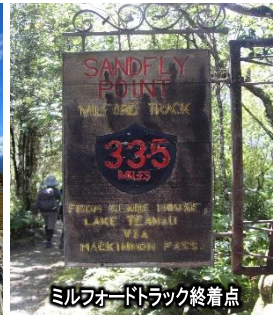
ミルフォードトラック終着点