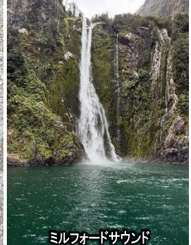
ミルフォードサウンド