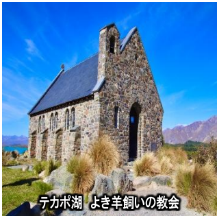
テカボ湖 よき羊飼いの教会