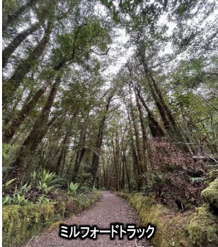
ミルフォードトラック